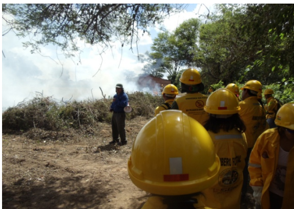
PASF práctica de quema controlada en Pailón – Santa Cruz

Además de estas actividades, el equipo ha estado realizando seguimiento y elaborando boletines sobre focos de calor en el área de intervención del Programa.