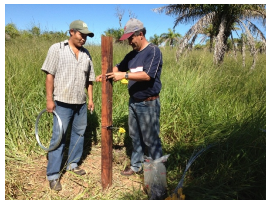
Mayo 2013: instalación de Unidad Demostrativa PASF, manejo de pastizales en Concepción – Santa Cruz