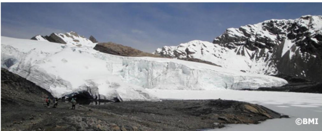
El glaciar Pastoruri en la Cordillera Blanca, Perú en 2012.

Usando la base más grande de observaciones glaciares existentes, Michael Zemp , director del Servicio Mundial de Monitoreo de Glaciares (WGMS) y sus co-autores han realizado la evaluación del estado de los glaciares del mundo más completa.