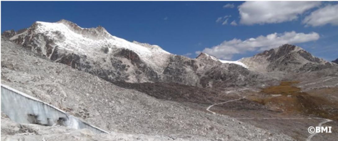
Glaciares en retroceso en la cabecera del Valle de Hichu Khota, Cordillera Real (2015).

Sin embargo, los puntos de observaciones no son distribuidos de forma homogénea alrededor de las regiones glaciares del mundo (ver mapa arriba). Mientras que los programas de monitoreo son bien establecidos en Europa, varias series de observaciones en América del Norte y Asia han sido descontinuadas. Para la región andina la existencia de puntos de monitoreo puede ser considerada satisfactoria. Según los investigadores, “a pesar de ciertas reducciones en el siglo XXI, la situación en América del Sur es alentadora, donde la mayoría de los países han instalado programas de monitoreo que, aunque son relativamente pocos, tienen continuidad”.