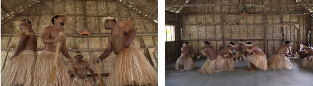
Baile de los Guerreros de las Marshall Islands

"Con estas acciones estamos manifestando nuestro reto a la industria de las energías fósiles. Es el carbón, el petróleo y el gas de ellos frente a nuestro futuro. Ambos no pueden coexistir. Y es nuestro futuro el que debe ganar".