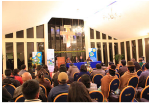
Impresiones del simposio

En el primer día del evento se presentaron más de 20 ponencias repartidas en tres mesas temáticas: gestión sustentable del agua, gestión de la biodiversidad ("la esponja verde") y economía local.