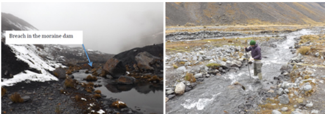
Brecha antigua en el dique de la morrena (izq.); medición de caudal (dcha.)

Se obtuvo datos para la geometría del valle y del río Pelechuco midiendo secciones transversales del río y del valle en 14 puntos diferentes. Se usó una cinta de 50 metros, que fue colocada a través del río de forma perpendicular al flujo del agua; luego se procedió a medir la profundidad y distancia del suelo (ver foto abajo).