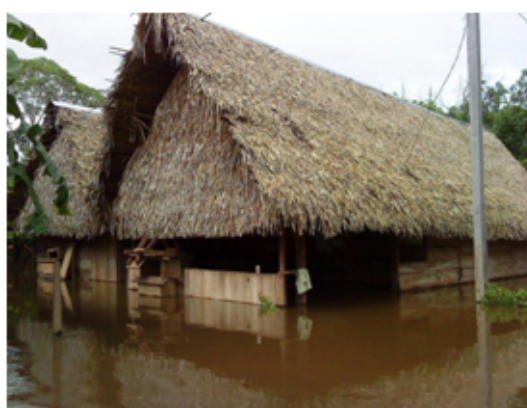
Plantación de cacao de la comunidad Nazareth destruido por las inundaciones (izq.) y casa en plena inundación