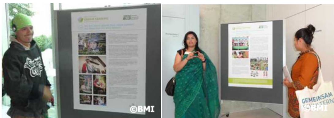
Participantes de Colombia (izq.) y Bangladesh (dcha.) presentando sus posters.

AKA , uno de los voceros de AgroArte en Medellín, Colombia, presentó su proyecto de agricultura urbana enfocado en el encuentro, la lucha contra la violencia, mediante el hip hop . “Así como las plantas crecen en suelo fértil, este colectivo surge desde la Comuna 13 para construir tejido social, resistencia, memoria y seguridad alimentaria”, comenta.